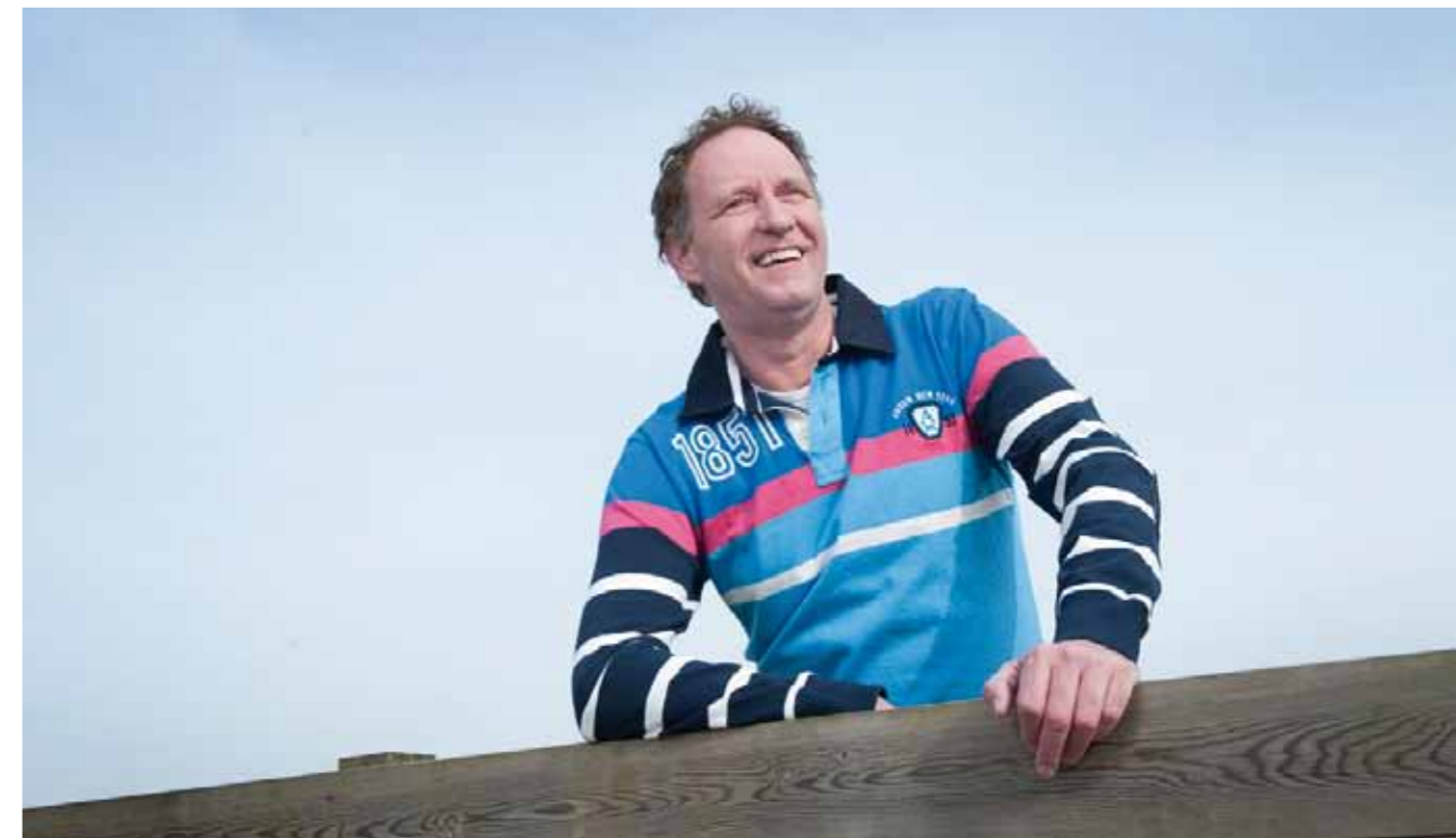
Piet Paulusma weerman, tv-persoonlijkheid

BEELDMERK/ERKENNING VOOR WIE EEN POSITIEVE BIJDRAGE LEVERT Evenementen/ activiteiten die op een of andere wijze een positieve bijdrage leveren aan de doelgroep/ gehandicaptensport ontvangen een (nog te ontwikkelen) keurmerk/ vignet.